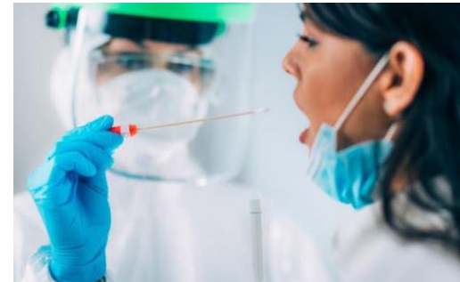
Tipo B: Tampone rapido