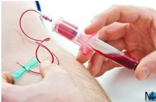
Tipo A: prelievo venoso