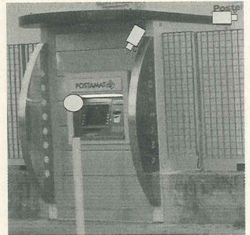
BOX ATM STAND ALONE